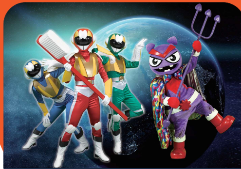
めざせ!!ハミガキヒーロー ミガキング 「マカロンとおかしのゆうえんち」 ～レスキュー六歳臼歯!～