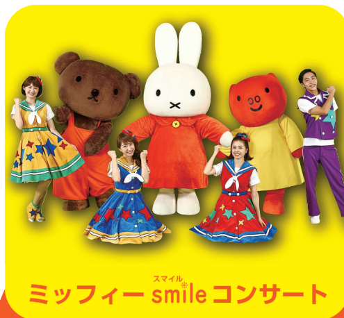
ミッフィー smile コンサート