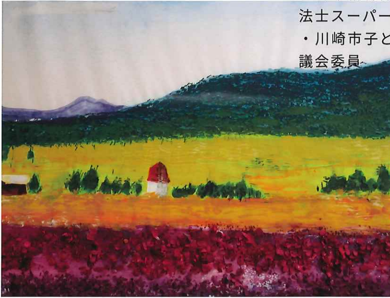
武田病院デイケア絵画プログラム2023年合同作品 (4枚のうちの一部を撮影)